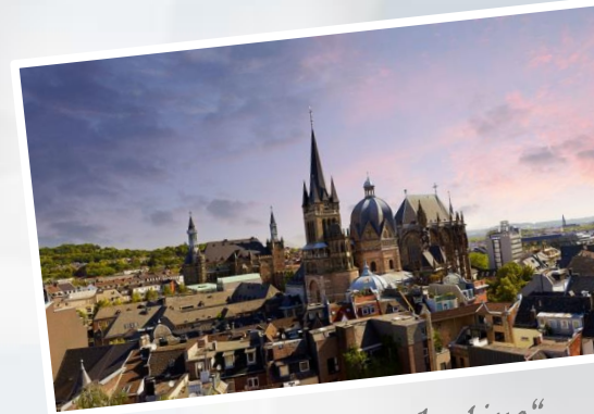
The Aachen „skyline“