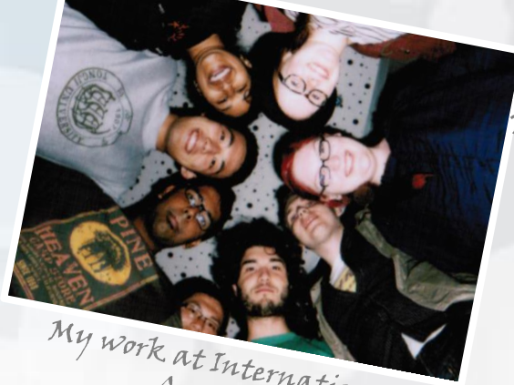
My work at International Academy